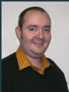
MANUEL KAUFMANN VON FOTOPRINT GBR